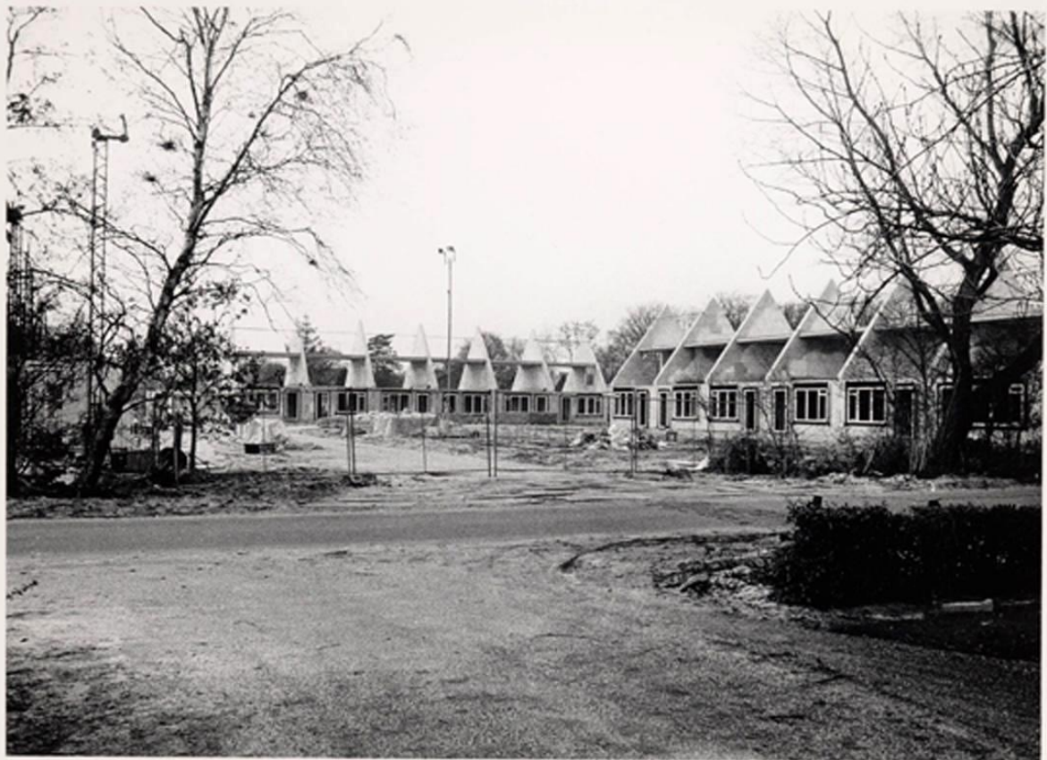
Premie A woningen uit de jaren tachtig.

Vroeger waren er premiewoningen waarbij mensen een rijkssubsidie konden krijgen op de aankoop van de woning. De subsidie werd elk jaar uitgekeerd onder bepaalde voorwaarden met een salaris indicatie. Ons voorstel is om provinciale subsidie in te voeren voor nieuwe koopwoningen, zodat ook mensen met lagere salarissen weer een eigen woning kunnen kopen. Dit om woningbezit te bevorderen en de woningnood te bestrijden.