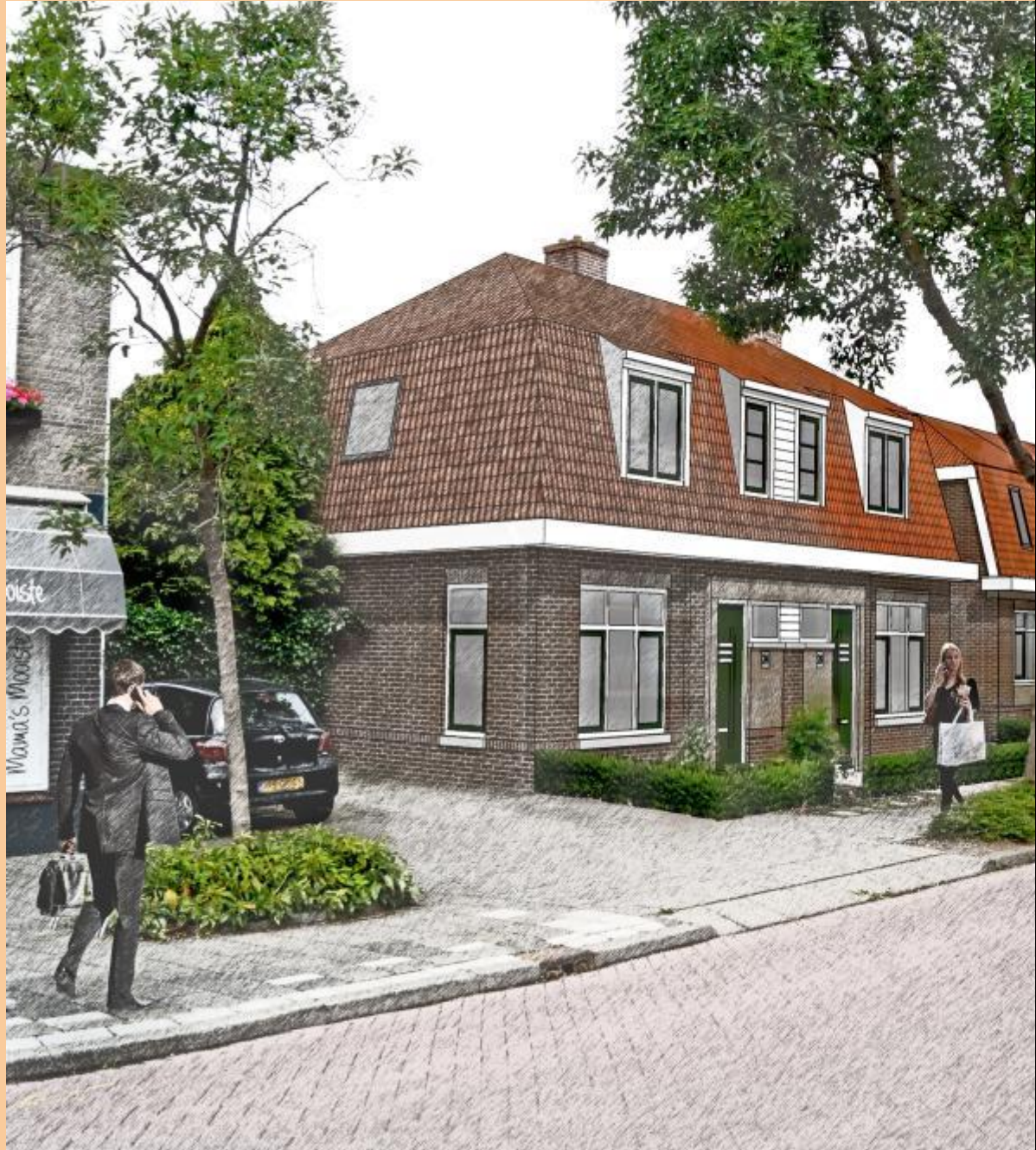
Nieuwe sociale woningbouw kerkweg in Lekkerkerk.

We willen dat er een eerlijker verdeling van de bouwgrond komt en niet dat sommigen hele grote percelen kunnen kopen. Zo kunnen er meer woningen worden gerealiseerd. Dus verplichting tot maximale kavelgrootte bij projectontwikkeling.